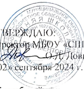
График проведения оценочных процедур на 2024-2025 учебный год